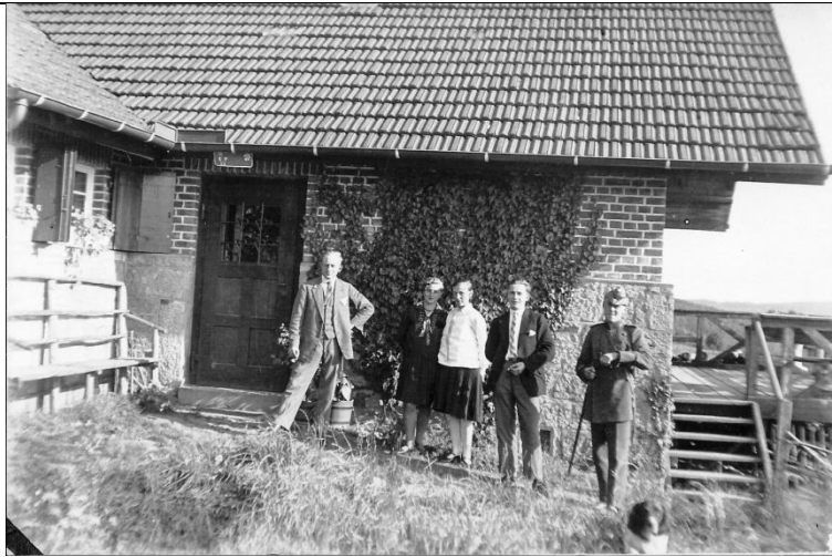
Altes Foto des "Förstershäuschens" im Bestand der Hagemann-Familie aus Alsberg