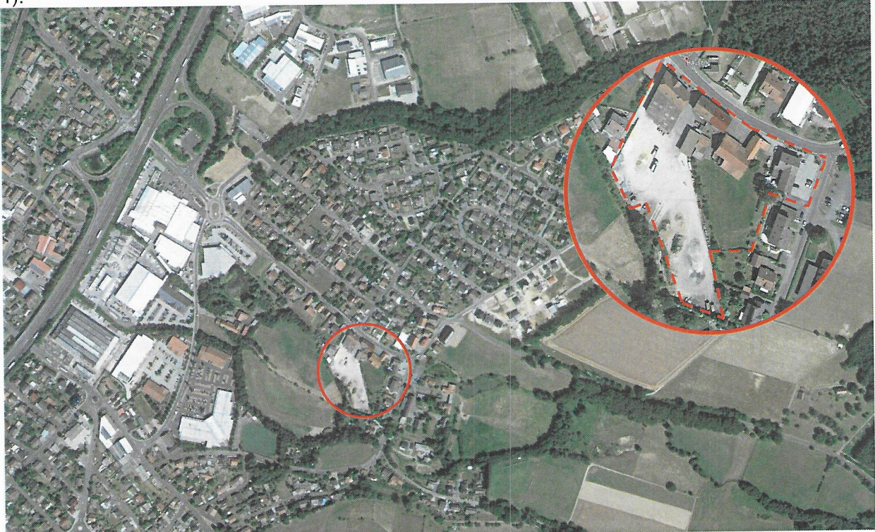
Abb. 1: Luftbild mit Geltungsbereich, ohne Maßstab

Flurstücke 53/A, 53/B, 53/C, 53/D, 53/7, 54, 55 und 56 ganz oder teilweise. Der Geltungsbereich des Bebauungsplans misst eine Größe von ungefähr 1,17 ha. (s. Abb. 1).