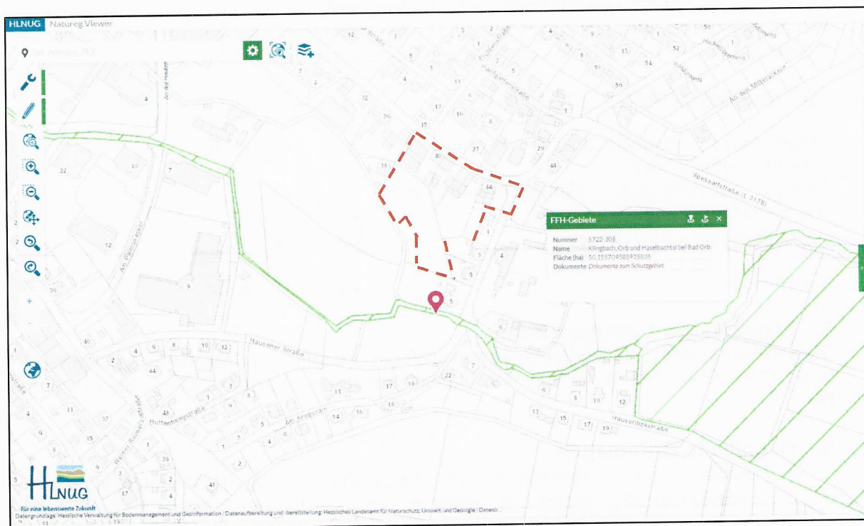
Abb. 2: Abfrage FFH-Gebiet Natureg Viewer, ohne Maßstab